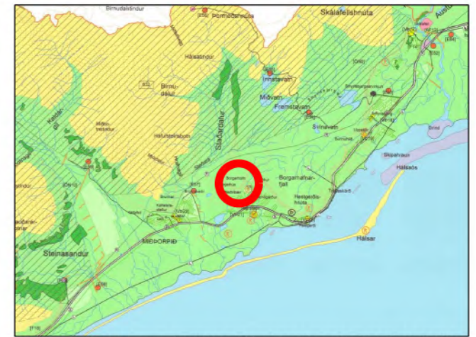
Hluti af sveitarfélagsupprætti Aðalskipulags Hornafjarðar 2012-2030